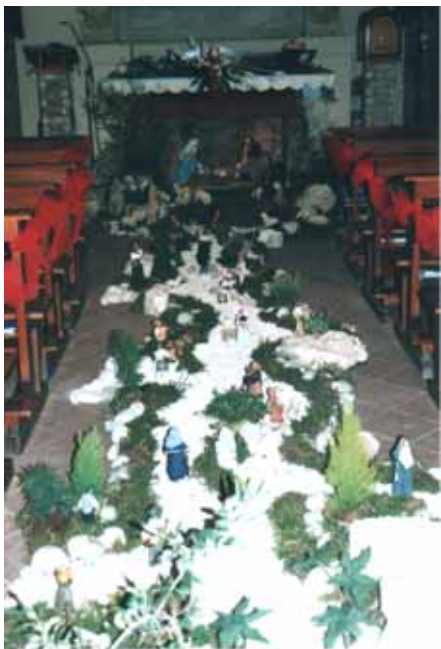
Presepe di Santa Maria della Quercia