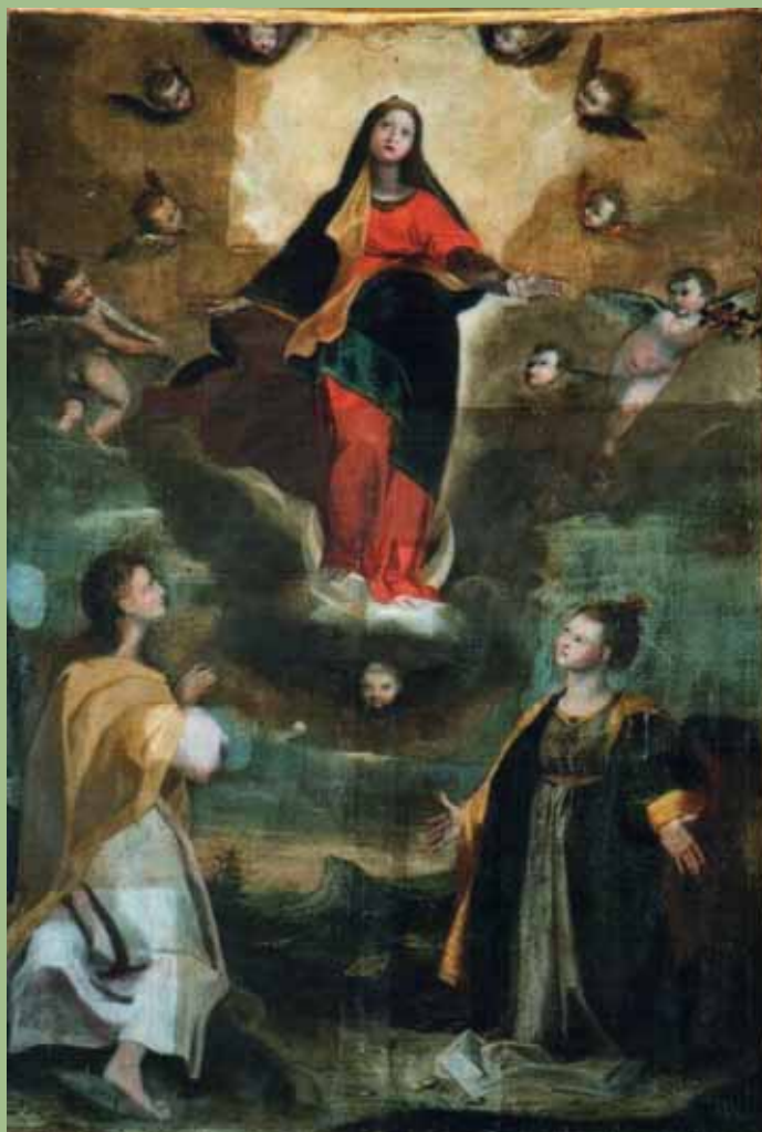
Mondavio - Chiesa Collegiata Tela della Vergine Assunta con S. Giovanni Evangelista e S. Caterina

Progetto per il rilancio turistico di Mondavio