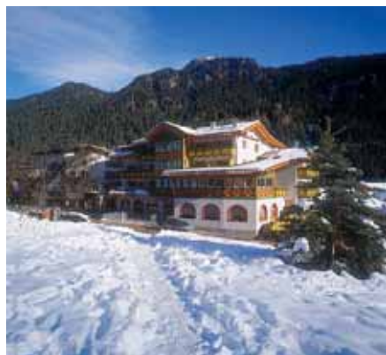
Albergo Alpino al Cavalletto

Anche per la camera singola con servizi, da concordare la disponibilità ed il supplemento tele- fonando in albergo