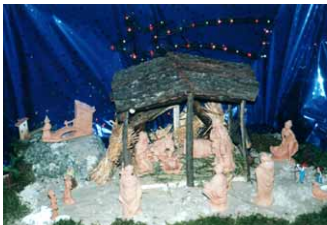
Presepe allestito dalle catechiste e dai ragazzi nella chiesa parrocchiale