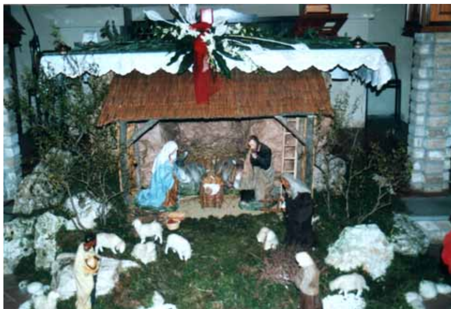
Presepe di Santa Maria della Quercia